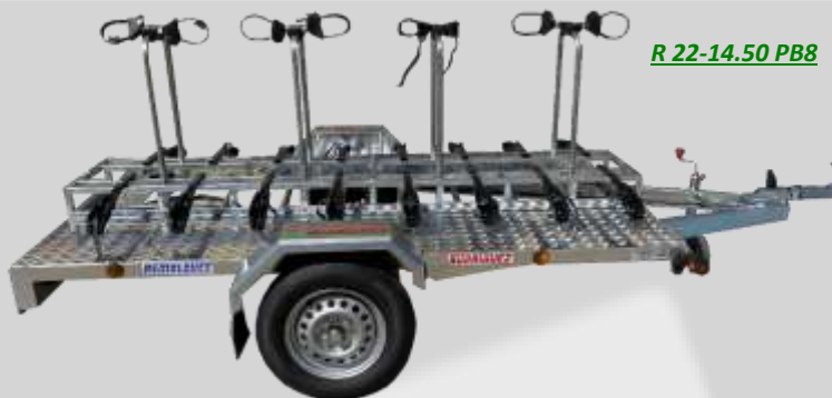
R 22-14.50 PB8