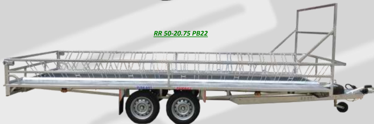
RR 50-20.75 PB22

En los de dos ejes, pasillo central Mayor comodidad en carga y descarga