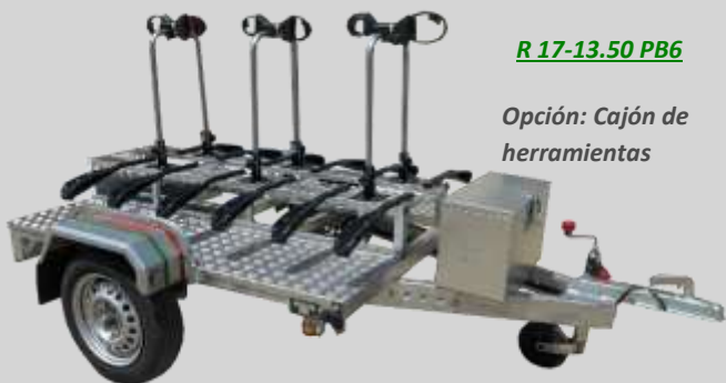
R 17-13.50 PB6