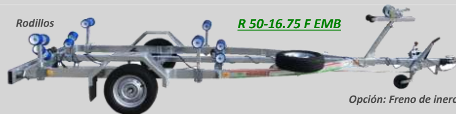
R 50-16.75 F EMB