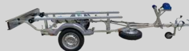
Trasera moto agua