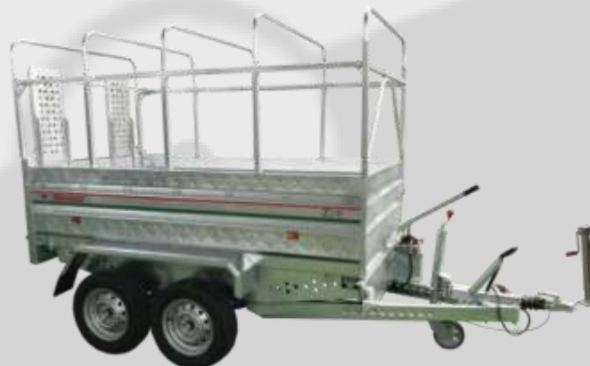
RR 25-14.75 BHM

Piso de tablero finlandés 15 mm. Chasis reforzado totalmente soldado Bomba eléctrica 12 V.