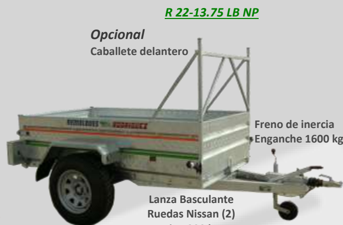
R 22-13.75 LB NP

Volquete manual Pilotos laterales Chasis reforzado