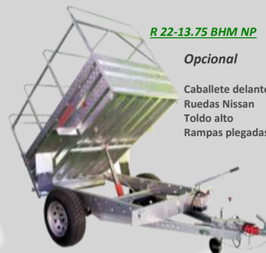
R 22-13.75 BHM NP

Lanza Basculante Ruedas Nissan (2) Eje 1300 kg