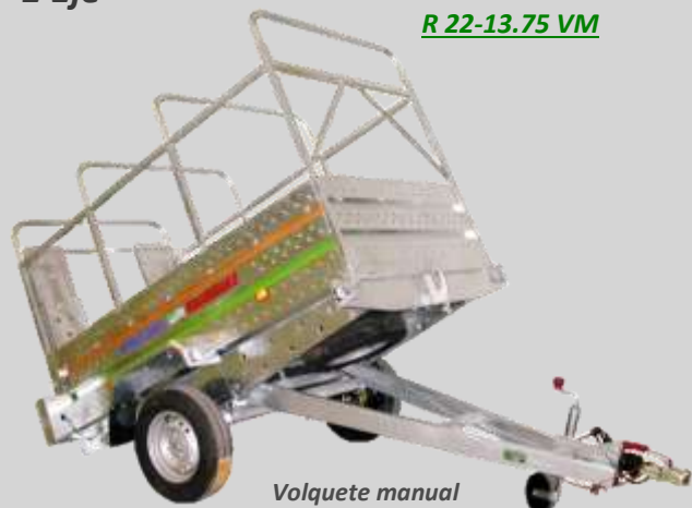
R 22-13.75 VM

Volquete manual Pilotos laterales Chasis reforzado