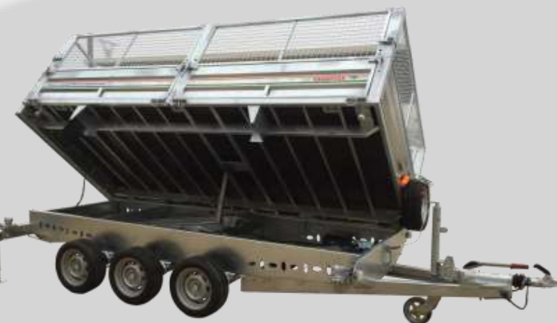
RRR 40-20.350 BHET

Barras laterales, caballete delantero rampas en cartola trasera, arquillos Bomba manual de doble embolada.