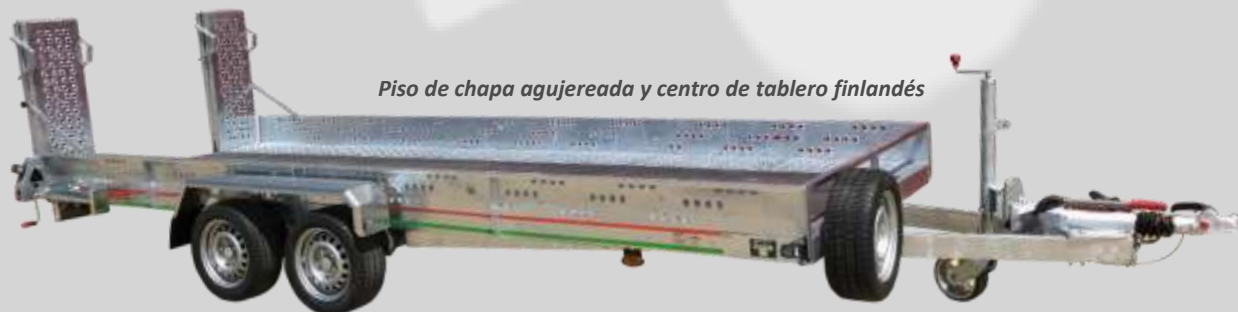
Piso de chapa agujereada y centro de tablero finlandés