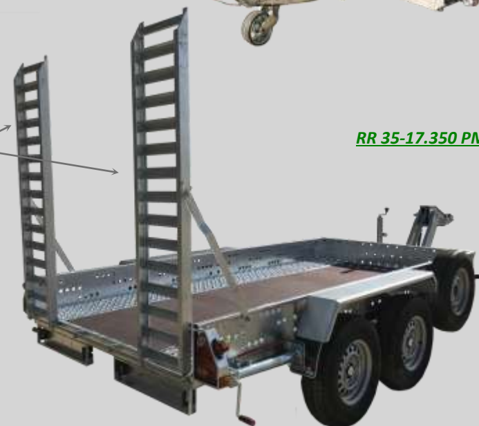
RR 35-17.350 PM LR