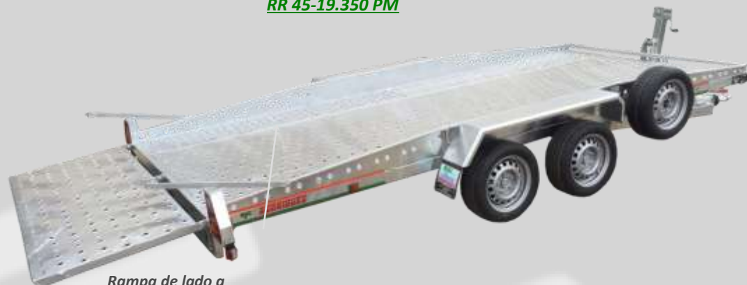
Rampa de lado a lado de una pieza